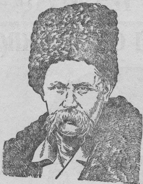
Т. Г. ШЕВЧЕНКО

Запрещенные стихотворения Шевченко передова-