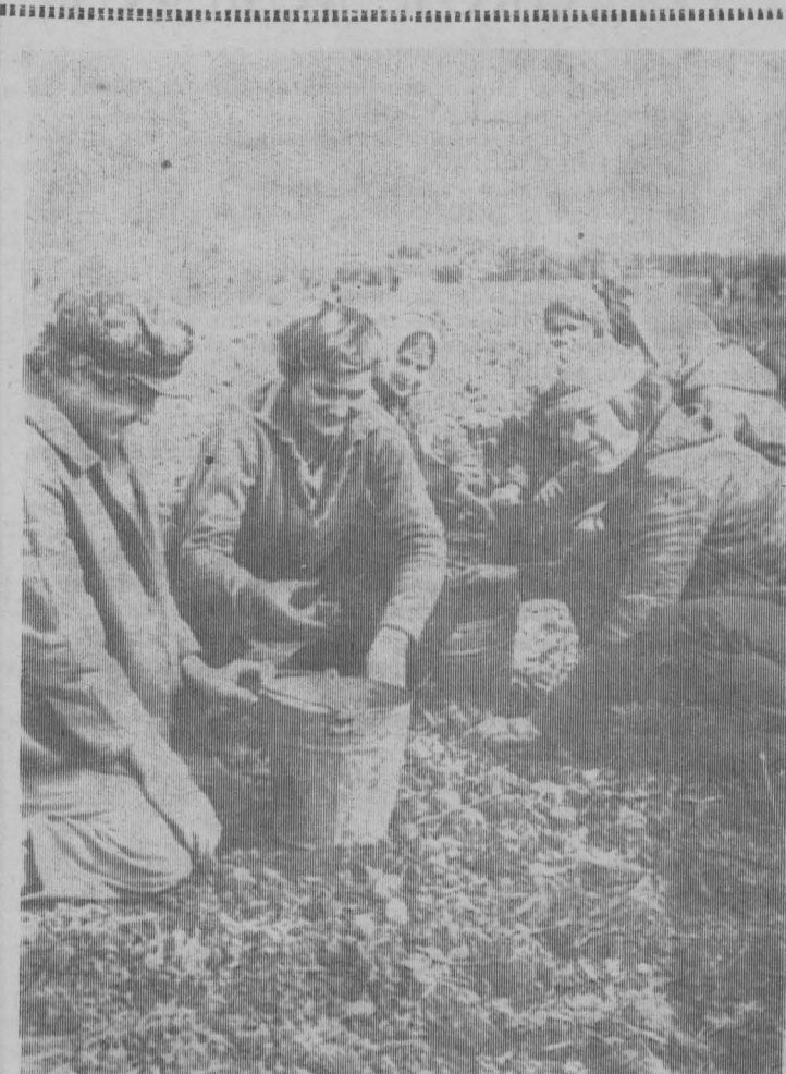
Хорошую помощь совхозу в уборке картофеля ежегодно оказывают учащиеся Верх-Чебулинской школы. Вот и в этом году ребята дружно вышли на поле.