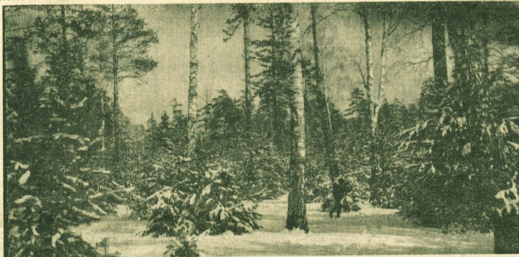
В ЗИМНЕМ ЛЕСУ.