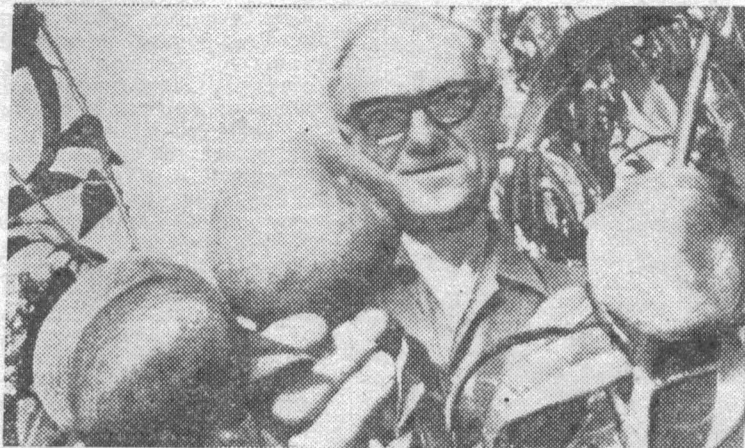
500 граммов — таков вес этих гигантских персиков, выращенных венгерским селекционером Шнейдером. Десятилетнее дерево дало в этом году около 40 таких плодов.