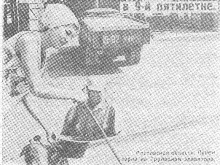
Ростовская область. Прием зерна на Трубечинском элеваторе.