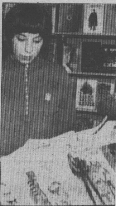
Наши торговые объединения, как все организации и производственные коллективы, встали на ударную 10-недельную трудовую вахту в честь