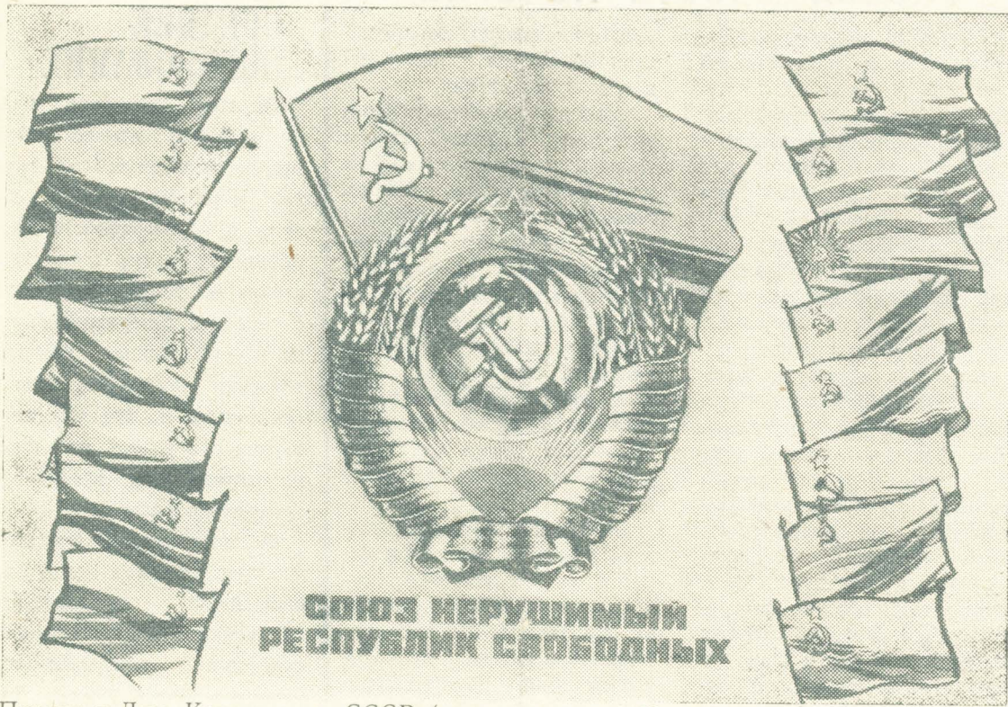
Плакат к Дню Конституции СССР (издательство «Изобразительное искусство»).