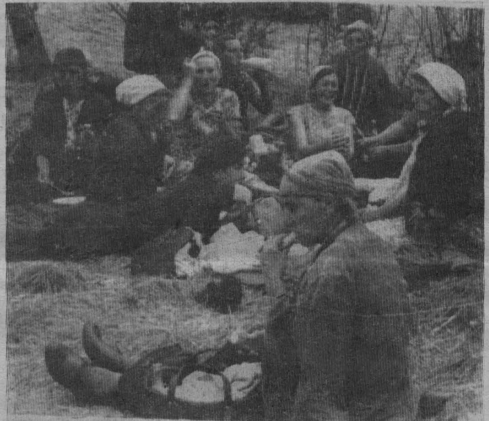
НА СНИМКАХ (сверху вниз):

Техника здесь играет подсобную роль. Когда стога осядут, стогометчик, подняв кону, везет ее туда, где вершина требует поправки.