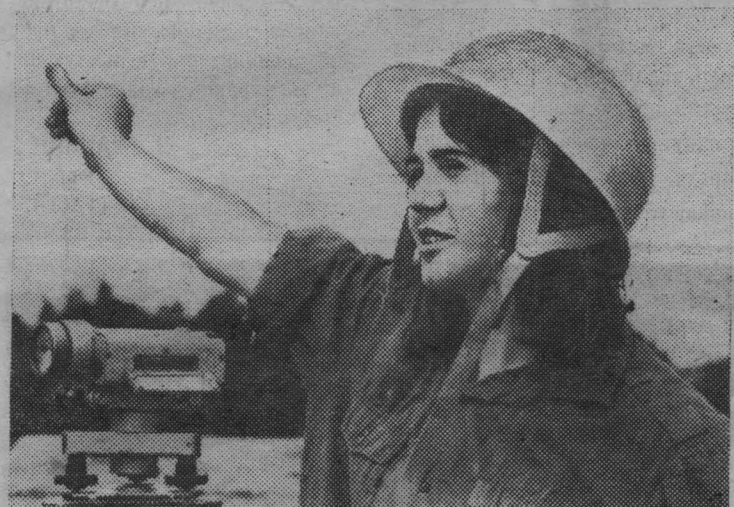
Студенты московских вузов с увлечением и молодым задором трудятся на ударных стройках пятилетки.

В столичных студенческих строительных отрядах насчитывается 50 тысяч человек. Московские вузовцы на строительстве 2500 объектов должны освоить около 90 миллионов рублей капиталовложений.