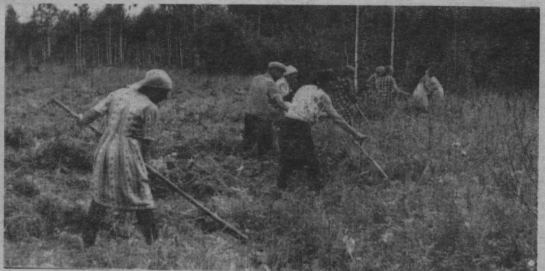
Так заготавливается недостающее количество корма в Розовском отделении Чебулинского совхоза. (Читайте репортаж на 2-й странице).