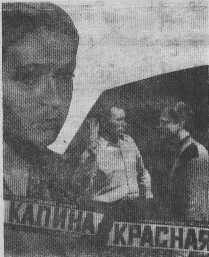
На снимке: кадр из фильма «Калина красная».