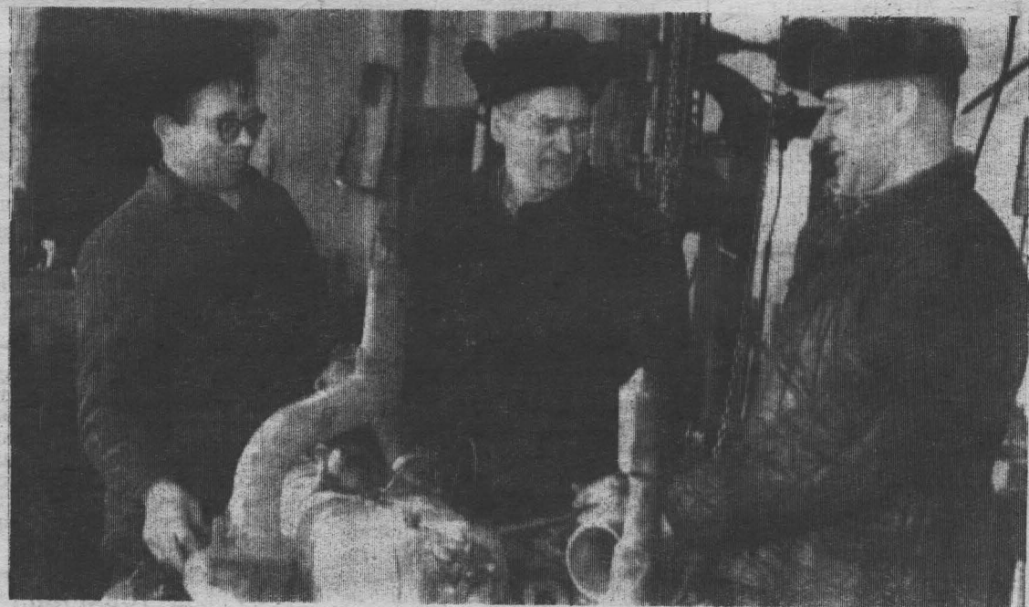
В Чумайском совхозе идет деятельная подготовка к посевной кампании, ремонтируют технику.

Хорошо трудятся на ремонте двигателей (на