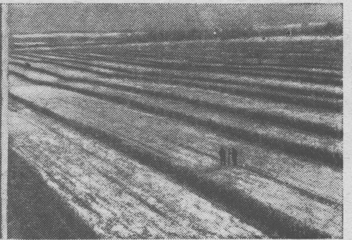
НА ПРАВОМ СНИМКЕ: в совхозе широко применяется возделывание озимых между кулисами. Живые изгороди из подсолнечника хорошо задер-

живают снег, предохраняют почву от ветровой и водной эрозии.