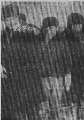
Наставление перед стартом.

Теперь стартуют параллельно 6 и 7 классы. Среди них с разрывом в 5 секунд победили ребята 6 «А» класса своих наиболее вероятных противников из параллельного «Б» класса.