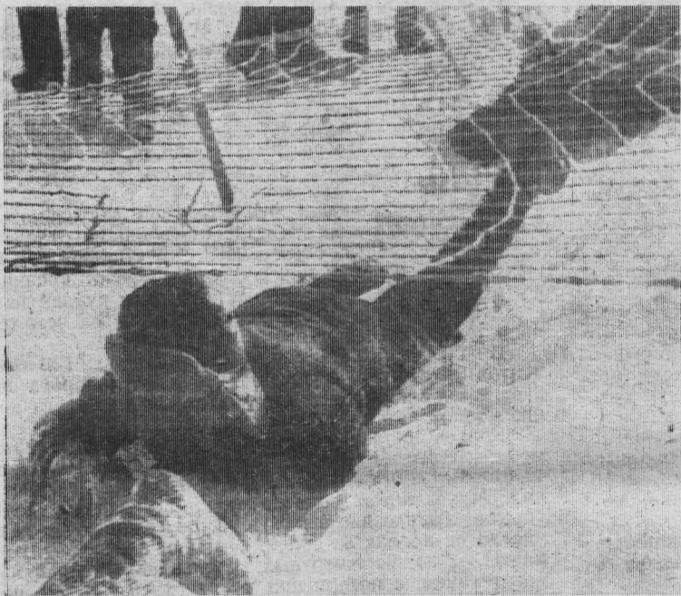
И по-пластунски надо уметь ползать

Затем в строю остаются только участники эстафеты. Придирчивые судьи отмечают и форму, и организованность команд, потому при подведении итогов все это будет отражено в штрафном времени.