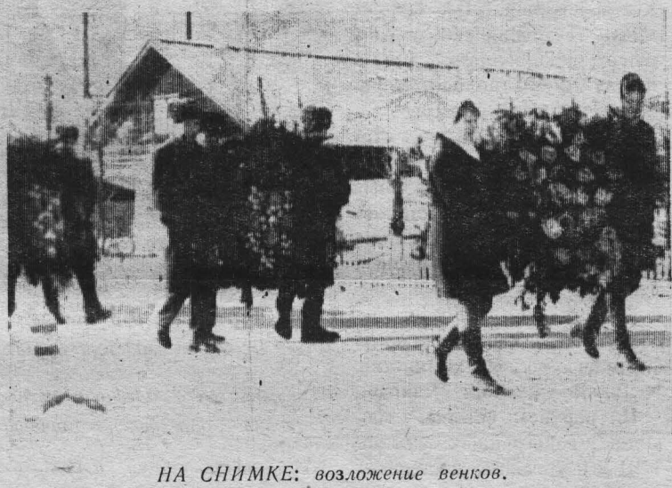
НА СНИМКЕ: возложение венков.