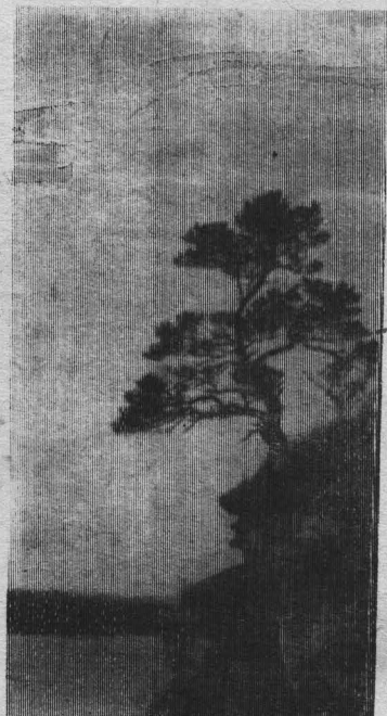
Над Томью — рекой.

Газета выходит по вторникам, четвергам и субботам объемом 1 п. л. Адрес редакции: 652170, с. Верх-Чебула, ул. Юбилейная, 11. Телефоны: редактора — 0-40, зам. редактора — 0-31, ответственного секретаря — 0-43, отделов сельского хозяйства и культуры — 0-31 (два звонка). Отпечатано в Чебулинской типографии Управления издательств, полиграфии и книжной торговли, ул. Ленина, 22. Тел. 0-43 и 0-41.