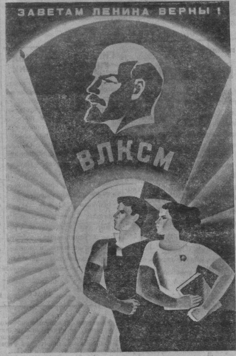
Плакат художника В. Рыбникова «Заветам Ленина верны!» (издательство «Изобразительное искусство»).