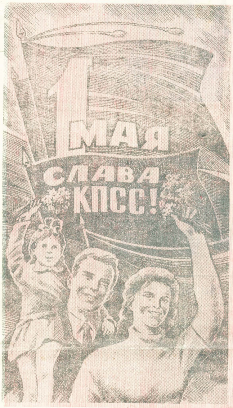
Рисунок художника С. АНДРЕЕВА.