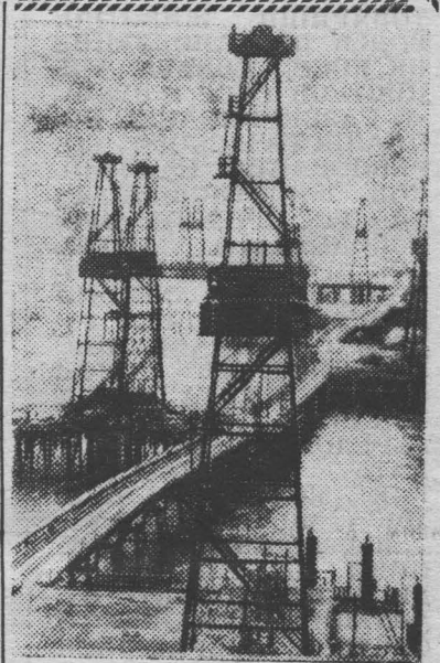
Азербайджанская ССР. На сотни километров протянулись над Каспием эстакады морских нефтепромыслов. На снимке — наводная улица нефтегазодобывающего управления имени Семеновского.