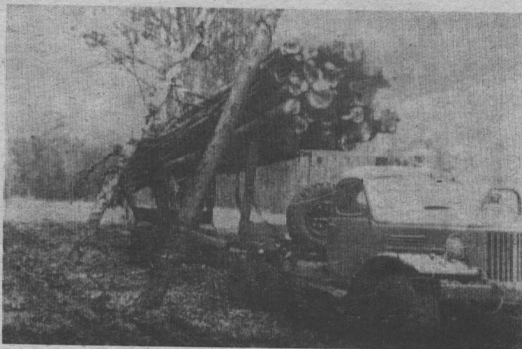
Скоро 20-кубовый «воз» тронется к лесозаводу.