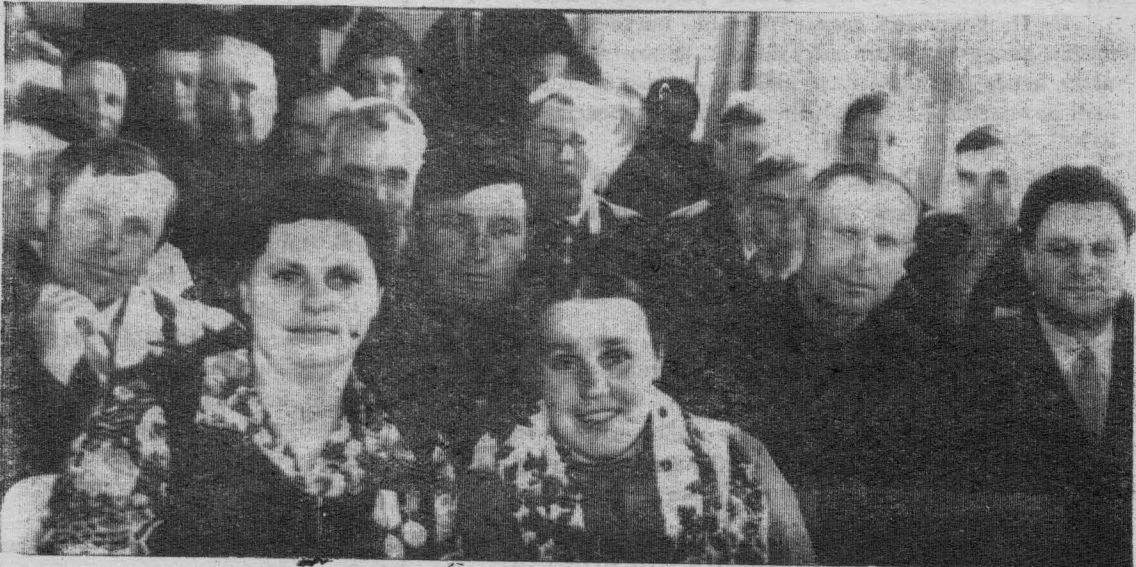
В зале заседаний... награждают товарищей.

После торжественного собрания, в районном Доме культуры состоялся концерт.