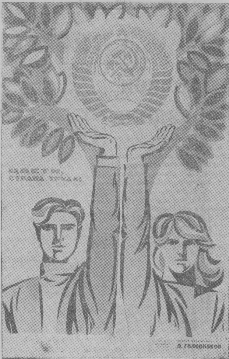
ПЛАКАТ ХУДОЖНИКА Л. ГОЛОВКОВОЙ (ИЗДАТЕЛЬСТВО «ИЗОБРАЗИТЕЛЬНОЕ ИСКУССТВО»).