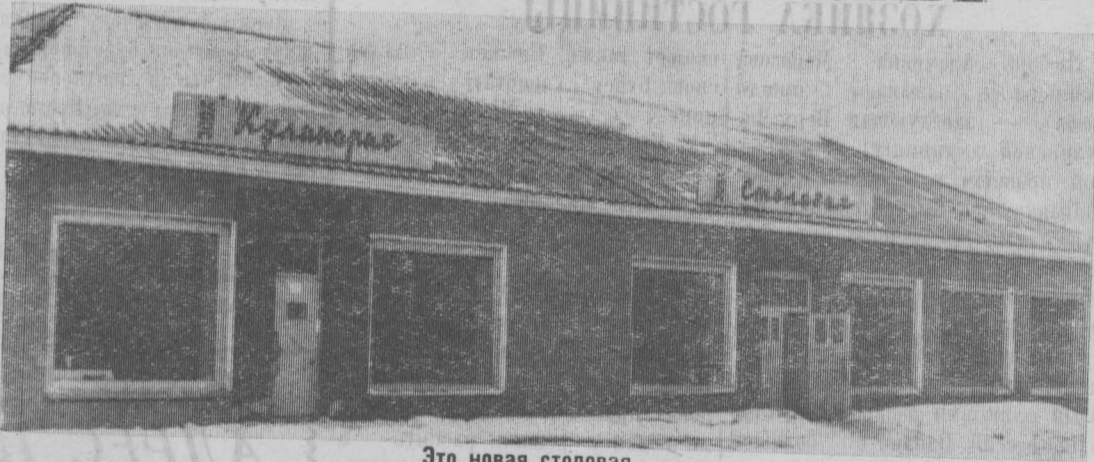
Это новая столовая

Столовая перешла в новое здание. Эта радостная новость облетела жителей районного центра.