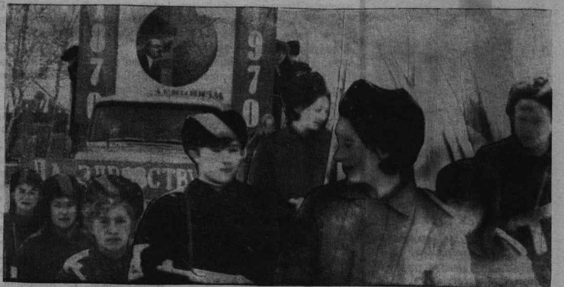
На улицах в селе Верх-Чебула 7 ноября.