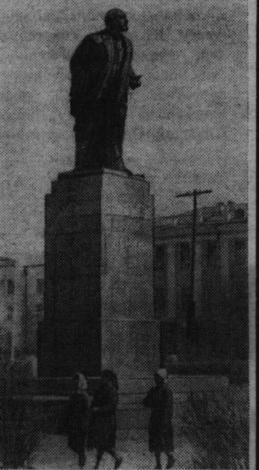
УЛАН-БАТОР. ПАМЯТНИК ВЛАДИМИРУ ИЛЬИЧУ ЛЕНИНУ, УСТАНОВЛЕННЫЙ В ЦЕНТРЕ СТОЛИЦЫ МНР.