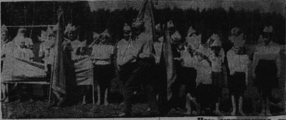
Идет торжественная линейка.