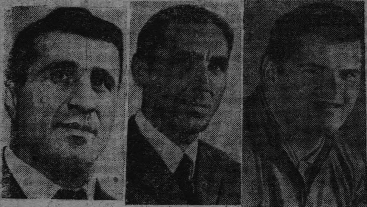
На снимках: Татьяна Талишева, получившая бронзовую медаль за прыжки в длину. Ее результат — 666 см. Штангист Дито Шидидзе (полужелезный вес), завоевавший серебряную медаль. Его результат в троеборье — 387,5 кг. Владимир Голубничий в спортивной ходьбе на 20 километров показал лучший результат — 1 час 33 мин. 58,4 сек. Он награжден золотой олимпийской медалью. Легкоатлет Эдуард Гущин толкнул ядро на 20,69 метра, занял третье место и получил бронзовую медаль.