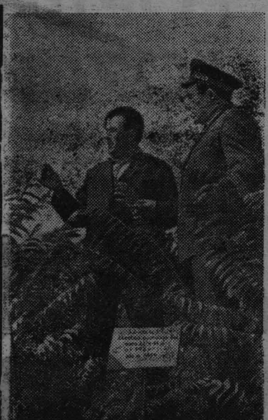
Радековский лесхозаг — одно из передовых хозяйств Львовщины. Большое значение здесь придано восстановлению лесов. Ежегодные насаждения в два раза превышают площадь вырубки.

В рассаднике значительное место занимают сосна, лиственница, барзатное дерево и другие ценные породы.