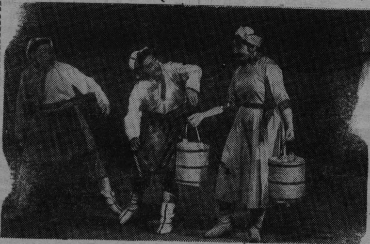
Улан-Батор сегодня. Танцевальная сценка «у родника» в исполнении артистов театра оперы и балета Монгольской Народной Республики.