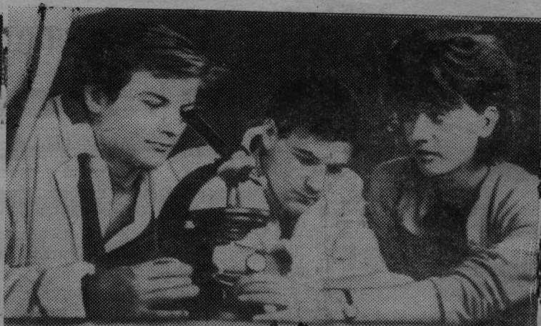
В социалистической Югославии созданы все условия для получения гражданами образования и повышения квалификации. Ежегодно сотни тысяч учащихся заканчивают общеобразовательные и специальные школы, десятки тысяч квалифицированных специалистов выходят из стен высших учебных заведений.