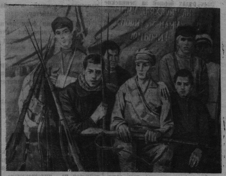
«Художники Москвы — 50-летию Октября» — так называется выставка, открывшаяся в Москве. Экспонируется около двух тысяч произведений живописцев, скульпторов, графиков, художников плаката, театра и кино, декоративно-прикладного искусства. На снимке: экспонат выставки — картина К. Максимова «Комсомольцы 20-х годов».

Научные исследования, выполненные советской автоматической межпланетной станцией «Венера-4», — новая выдающаяся победа советской науки и техники, важнейший этап в исследовании планет солнечной системы.