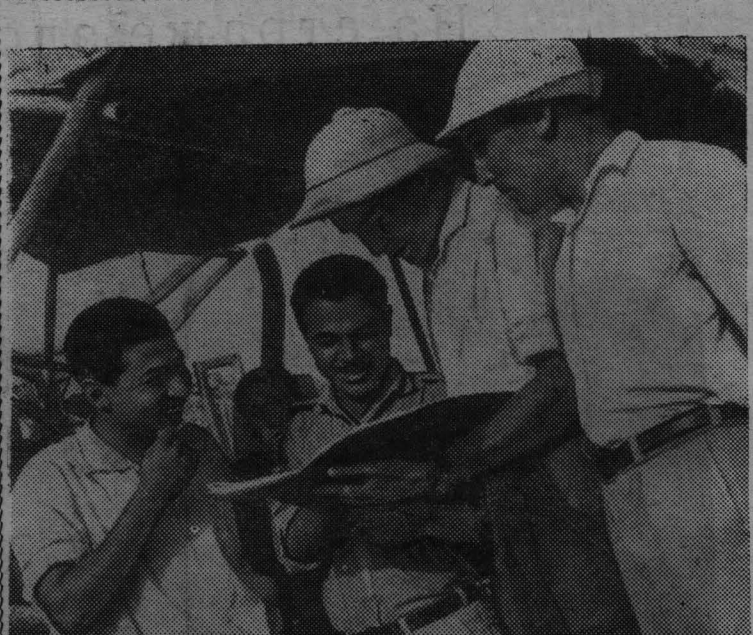
В Объединенной Арабской Республике советские и арабские строители в тесном содружестве возводят сооружения высотной Асуанской плотины.