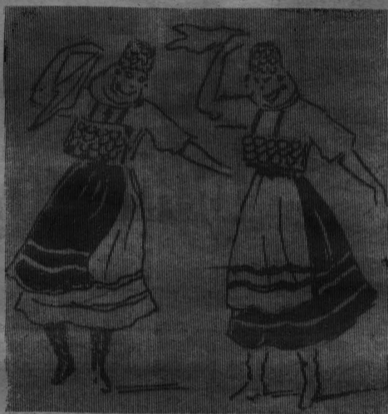
Чувашский народный танец (пос. Прележ).