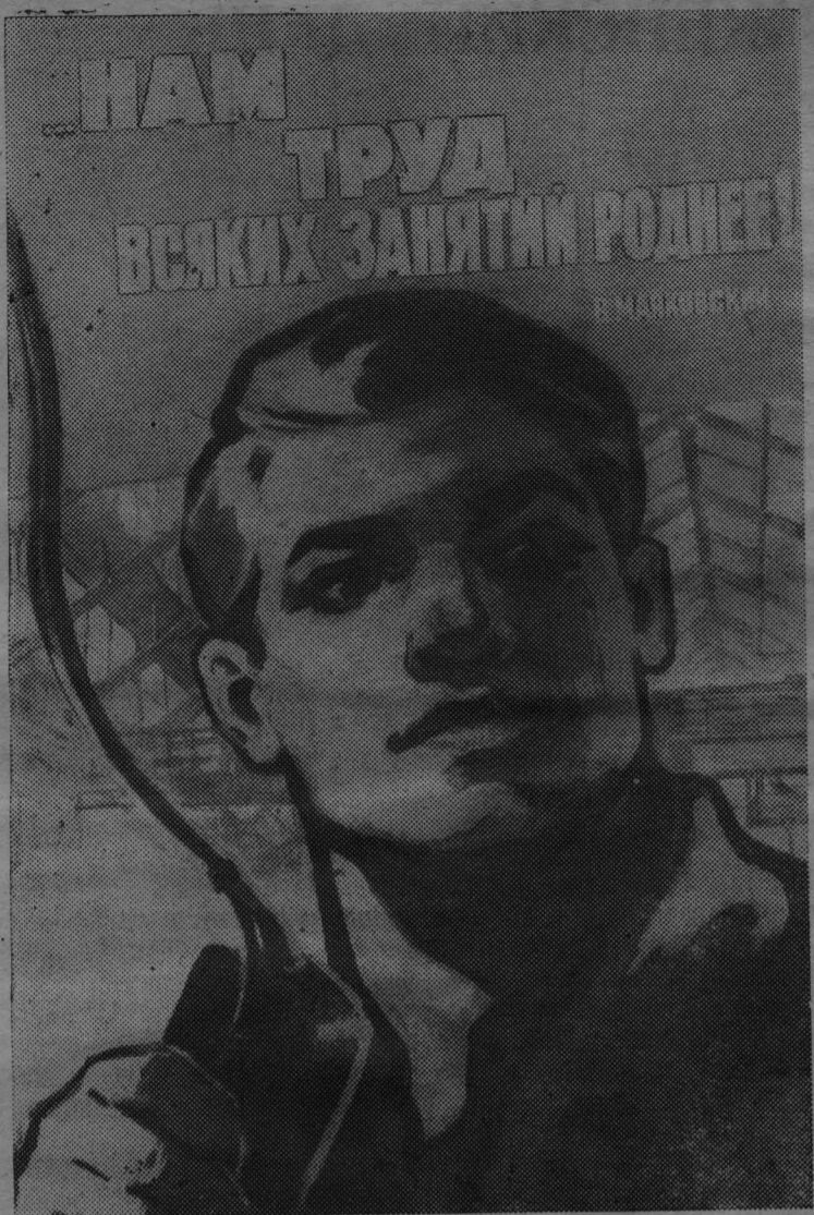
Плакат художника В. Сачкова (ИЗОГИЗ).