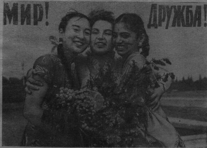
Плакат художника А. Устинова (ИЗОГИЗ).