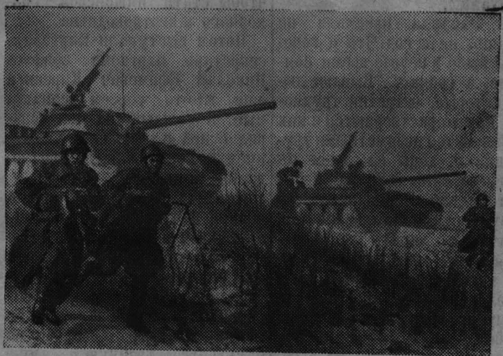
На снимке: на тактических учениях.

При подведении итогов соревнования обязательно должно учитываться качество выполненных работ, а также изучение пропадной системы земледелия и ход учебы и подготовки кадров к выращиванию высоких урожаев кукурузы, сахарной свеклы и других культур.