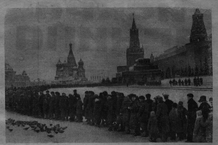
21 января 1958 года исполнилось 34 года со дня смерти Владимира Ильича Ленина.

Повышение уровня идеологической, политической работы парторганизаций позволит еще шире развернуть социалистическое соревнование трудящихся района за успешное выполнение задач, поставленных на 1958 год.