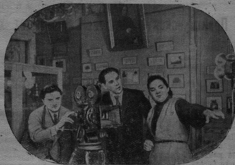
Куйбышевская киностудия ведет съемку нового цветного документального фильма «Рождение Буревестника», посвященного 90-летию со дня рождения А. М. Горького.