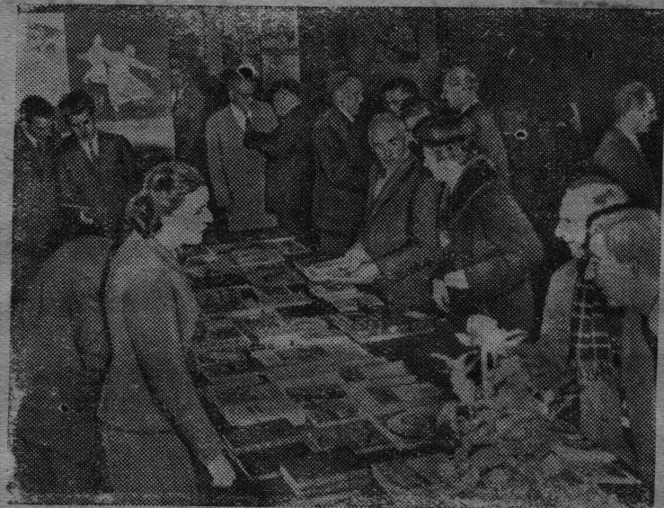
Швейцария. В Женеве открылась выставка «СССР 1957 года». Выставка организована обществом «Швейцария—СССР».

Лучшее время закладки глубокой подстилки — летние и осенние месяцы, т. е. сухое время года, когда все полезные процессы в подстилке на-