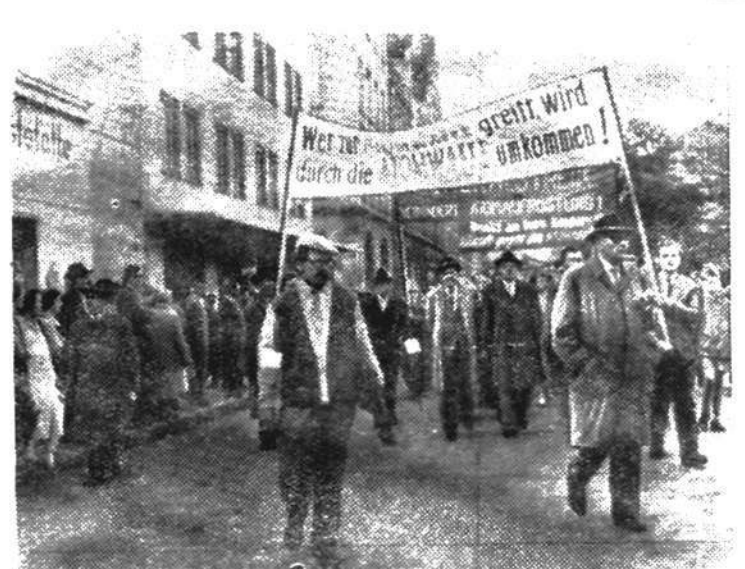
Федеративная Республика Германии. В Мюнхене состоялся митинг протеста против оснащения бундесвера атомным оружием. На снимке: трудящиеся направляются на митинг протеста. Транспарант гласит: „Кто прибегнет к атомному оружию, тот от него и погибнет!“

—К продаже билетов приступят 1 сентября этого года. Распространение их будет проводиться при строгом соблюдении принципа добровольности через уполномоченных комиссий содействия государственному кредиту и сберегательному делу на предприятиях, в учреждениях и колхозах, в сберегательных кассах, на почте, в магазинах, кинотеатрах, в газетных киосках.