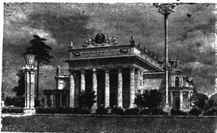
Москва. Всесоюзная сельскохозяйственная выставка. Павильон «Российская Советская Федеративная Социалистическая Республика».

Колхозники уже просмотрели фильм «Свадьба с приданым», «Судьба Марини», «Аттестат зрелости» и несколько сельскохозяйственных кинокартин.