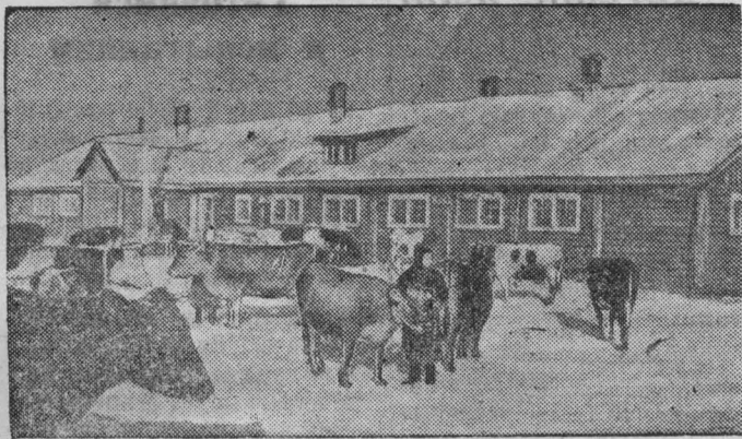
Молочно-товарная ферма колхоза имени Чкалова (Кунцевский район, Московская область) имеет 57 голов рогатого скота. Доярки взяли на себя обязательство довести удой в 1941 г. до 4100 литров на каждую фуражную корову. Для повышения удою доярки ежедневно выгоняют коров во двор на двухчасовую прогулку.