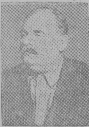
Председатель Президиума Верховного Совета РСФСР т. Алексей Егорович Бадаев.

сти к нелегальной антифашистской организации. Все обвиняемые осуждены к различным срокам тюремного заключения — от 1 до 4 лет.