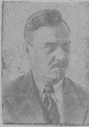
Председатель Совета Народных Комиссаров РСФСР Николай Александрович Булганин.