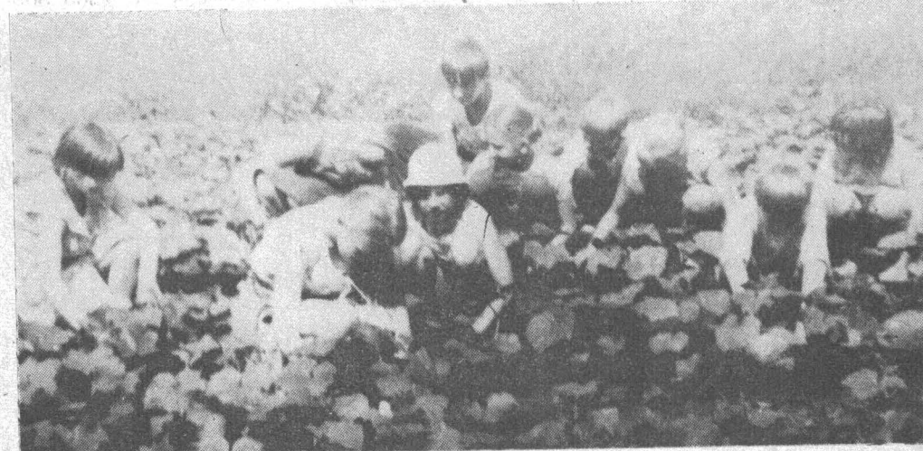
НА СНИМКЕ: на полоске огурцов показались сорняки. Нет, не расти им, когда такие дружные ребята на пришкольном участке.