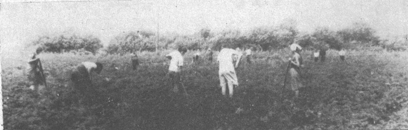
НА СНИМКЕ: картофельное поле Старопестеревской средней школы — 0,6 гектара. На весь учебный год школьная столовая теперь будет обеспечена

Плохое впечатление оставила школьная производственная бригада. После знакомства с ее работой напрашивается вывод, что ни в школе, ни у руководства совхоза «Моховский», который является базовым хозяйством школы, ничего не предпринимается для улучшения трудового воспитания школьников, как