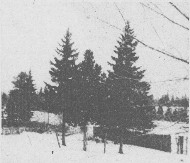
ЗИМНИЙ ЭТЮД.

Оплата труда сдельно-премиальная. Квартирами обеспечиваются в течение года.