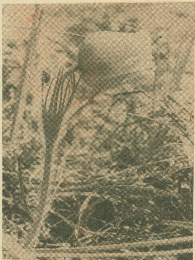
ВЕСЕННИЕ ЭТЮДЫ.

— Хочу я в море превратиться, мама, Хочу под небесами засиять... — О нет, сынок, паду к твоим ногам я, — Коль станешь морем, как тебя обнять? — Хочу высокой стать вершиной, мама, И свет ее тебе одной отдать... — О нет, сынок, паду к твоим ногам я, — Вершиной станешь, как тебя достать?! — Хочу я в солнце превратиться, мама, Чтоб светить земле и небесам... — О нет, сынок, паду к твоим ногам я, — Даруя свет, стореть ты можешь сам! — Хочу в родник я превратиться, мама, Струиться с гор, в полях звенеть, в садак... — О нет, сынок, паду к твоим ногам я, — Ты сам гора, уместиться ль в горах?! — Хочу я в песню превратиться, мама, Чтоб грусть развеять с твоего лица... — О да, сынок, паду к твоим ногам я, — И так ты моя песня без копца.