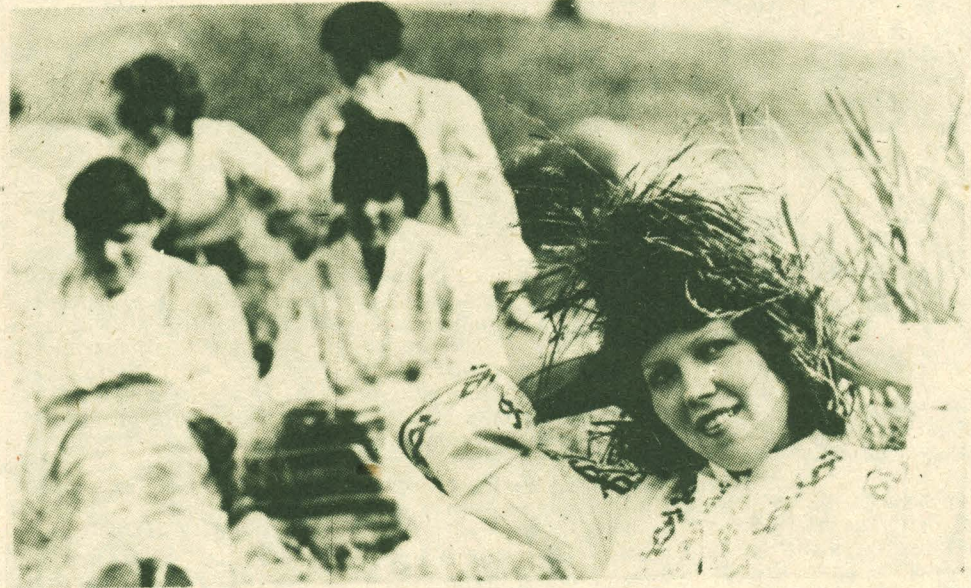
традиции успешно развиваются, наполняясь новым содержанием и обогащаясь.

Не одно поколение сменилось с той поры, когда стали обживать эти места первые болгарские поселенцы. Через десятилетия пронесли и сохранили они традиции и обычаи предков. Редкий сельский праздник обходится без самобытных песен и танцев; в большом почете у сельчан болгарская национальная кухня... Старые