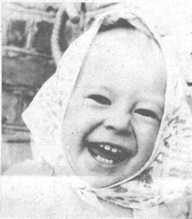
«Все люди на большой планете Должны всегда дружить. Должны всегда смеяться дети И в мирном мире жить».