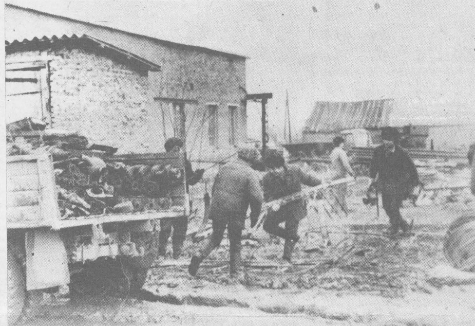
НА СНИМKE: на субботнике — группа работников совхоза «Рассвет». Она наводит порядок на территории РТМ, очищает ее от мусора и собирает металлолом.