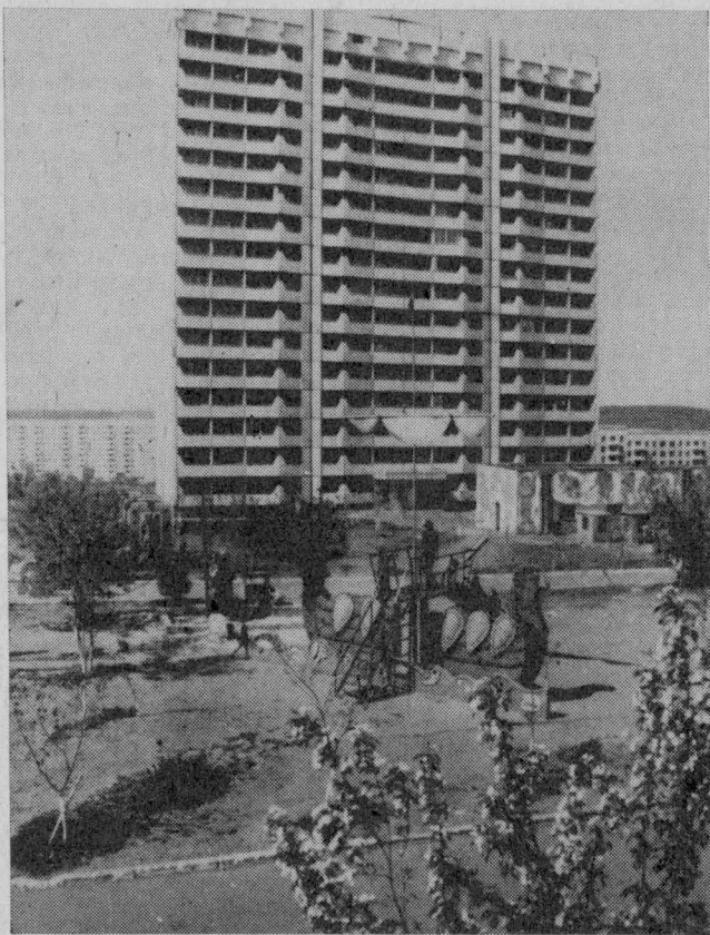
Города Кузбасса. Кемерово.

По всем вопросам, затронутым в письме, проведено производственное совещание с работниками ветучреждений города, включая мясо-молочные пищевые контрольные станции (ММПКС), на котором намечены меры по устранению имеющихся недостатков, по усилению контроля за исполнением всех правил и нормативов.