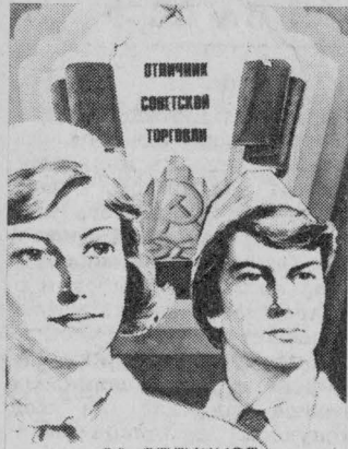
ЗА ОТЛИЧНОЕ ОБСЛУЖИВАНИЕ НАСЕЛЕНИЯ. Плакат художника Ю. Царева. Издательство «Плакат».