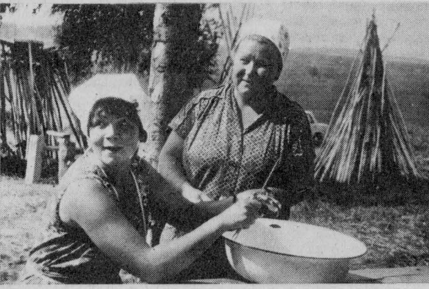
Обед скоро будет готов.