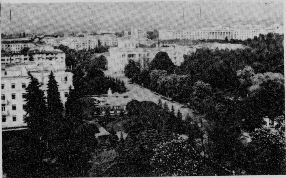
ВИД НА ЦЕНТР НАЛЬЧИКА.

А. ВАСИЛЕНКО, начальник отделения УПО УВД Кемеровского облисполкома.