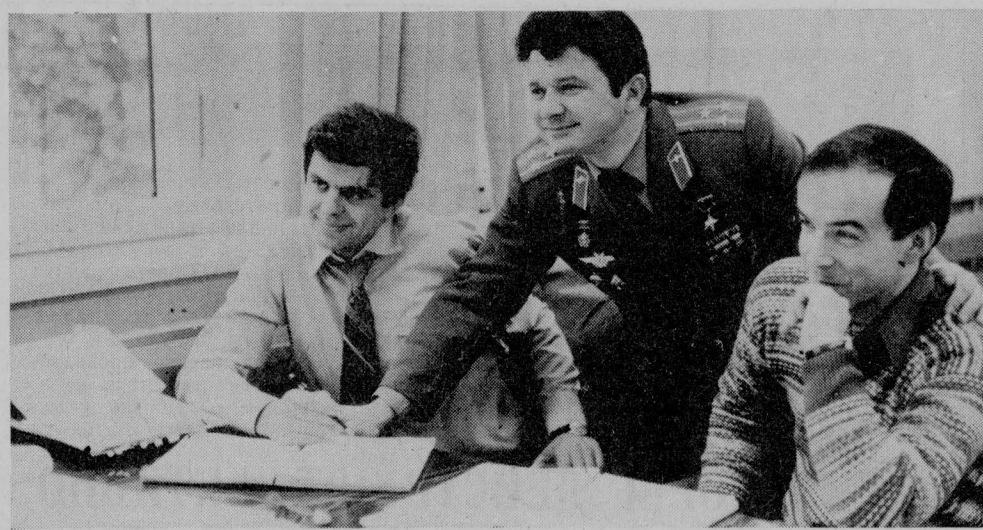
В центре подготовки космонавтов имени Ю. А. Гагарина идет подготовка к советско-французскому космическому эксперименту.

При закладке сенажа во многих хозяйствах идут по линии наименьшего сопротивления, то есть закладывают массу без подвяливания, что естественно, нарушает процесс консервирования трав и снижает качество сенажа. Силос также закладывается при высокой влажности до 85 процентов. Отсюда, вместе с соком, который выделяется при трамбовке, теряется от семи до десяти процентов сухого вещества. Потери ощутимые. Чтобы избежать этого надо применять полные псевды, а также солому при силосовании, которая предварительно измельчается. Если ее не измельчать, то получают большие отходы при скармливании.