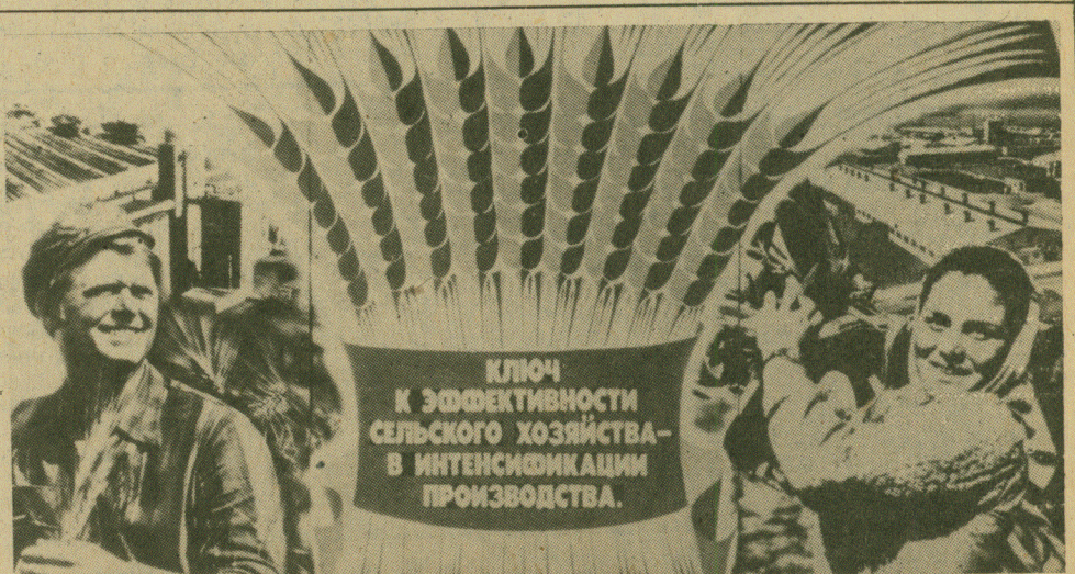
Плакат художника Л. Тарасовой.

□ □ □ жадны С тех пор, как сделал борозду однажды И бросил зерна в землю человек. Растут, бесчисленно множась, города Луна людским становится причалом... Начало ж остается все началом, И суть его все та же — борозда. Не забывай о ней у пирогов, И даже перед сном, смежая веки, Как забывают о начале реки, Раздвинув беспредельно берега. Успели утолить познания Сергей ВИКУЛОВ.