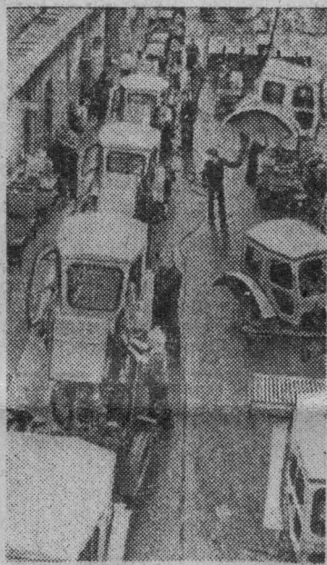
Липецк. Коллектив производственного объединения «Липецкий тракторный завод» с начала года отправил на поля страны дополнительно к заданию 150 тракторов. Липецкие тракторы работа-