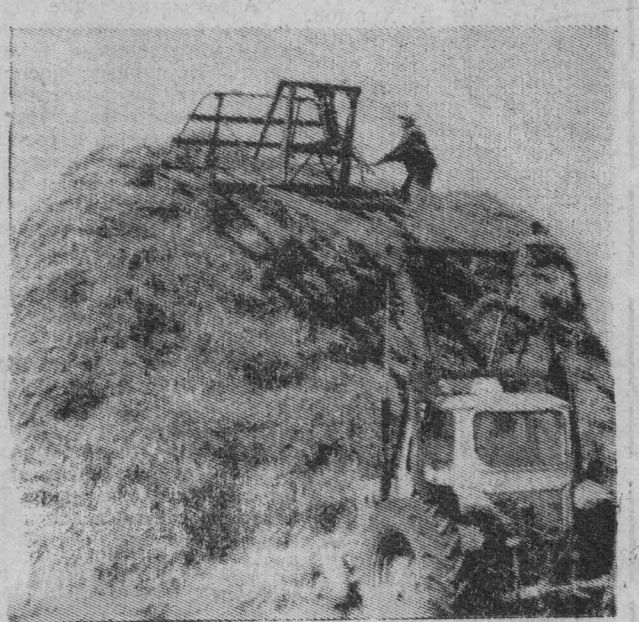
Вырос новый стог.

В. ЛУЧШЕВ, главный экономист совхоза «Рассвет».