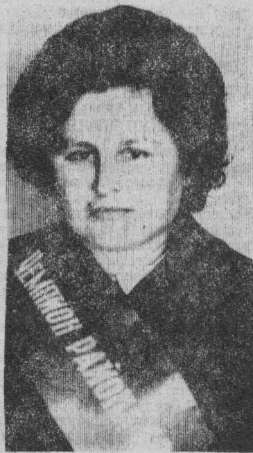
В народе говорят: приобрести профессию — это еще не все. Главное, чтобы она была по душе, по призванию, и только тогда человек сможет впол-