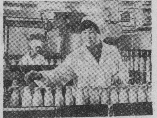
В столице Бурятии введен в действие новый молочный комбинат. Мощность комбината — 100 тонн молока в смену, что втрое превзойдет возможности существующего рядом старого предприятия.

А. ФЕДОСОВ, механизатор совхоза «Салаирский»