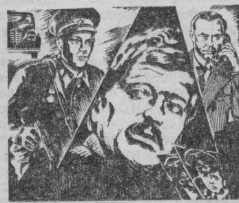
ПО ДАННЫМ УГОЛОВНОГО РОЗЫСКА

В марте на экранах вы можете посмотреть фильмы: