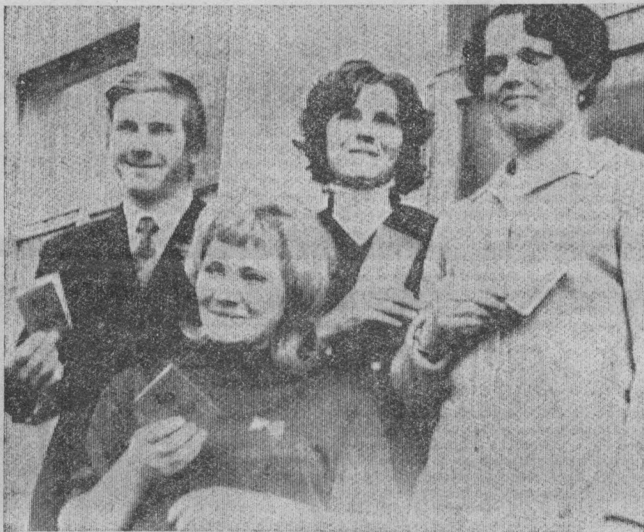
Молодым везде у нас дорога