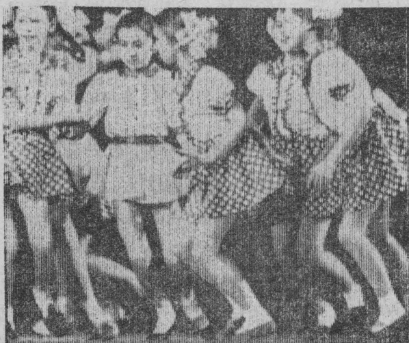
ПО СЕКРЕТУ ВСЕМУ СВЕТУ Творческая студия «Панорама».